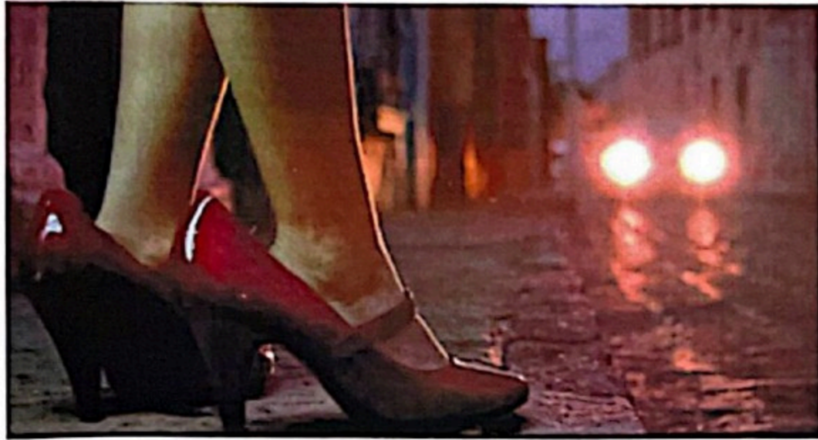
Cabe señalar que de acuerdo a los informes de la ONU, en Honduras el 80 por ciento de las víctimas de trata de personas o explotación sexual, son mujeres y niñas.

T egucigalpa. En el marco del diálogo interreligioso promovido por Ecuménicas por el Derecho a Decidir apoyado por la Iniciativa Spotlight, una alianza global entre la Organización de las Naciones Unidas y la Unión Europea, se ha realizado el foro "Protegiendo nuestras niñas de la explotación sexual", cuyo objetivo principal era analizar en un espacio público las principales causas y consecuencias que promueven esta actividad criminal. Cabe señalar que la organización Ecuménicas, se ha encargado de